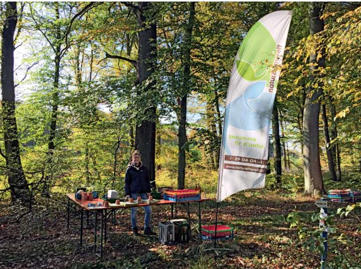
Bei der Marche gourmande alternative am 15. Oktober in Leudelingen wurde gezeigt, wie man selbst Vogelfutter für die Wintermonate herstellt.

2017 organisierte natur&ëmwelt etwa 150 Events.