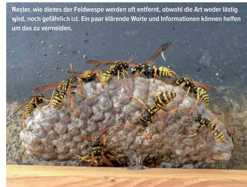
Nester, wie dieses der Feldwespe werden oft entfernt, obwohl die Art weder lästig wird, noch gefährlich ist. Ein paar klärende Worte und Informationen können helfen um das zu vermeiden.

Bereits im Jahr 2016 führte das Naturhistorische Museum eine Untersuchung der Stechmückenarten in Luxemburg durch, um herauszufinden ob die invasive Asiatische Tigermücke ( Aedes albopictus ) hierzulande vorkommt. Hierzu wurden an 10 übers Land verteilten Standorten Moskitofallen aufgestellt. Eine dieser Fallen stand am Haus von der