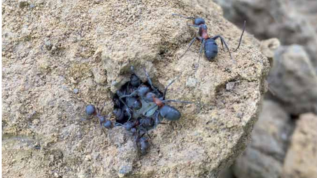
Die Große Wiesenameise ( Formica pratensis ) bringt ihre Brut in Sicherheit.