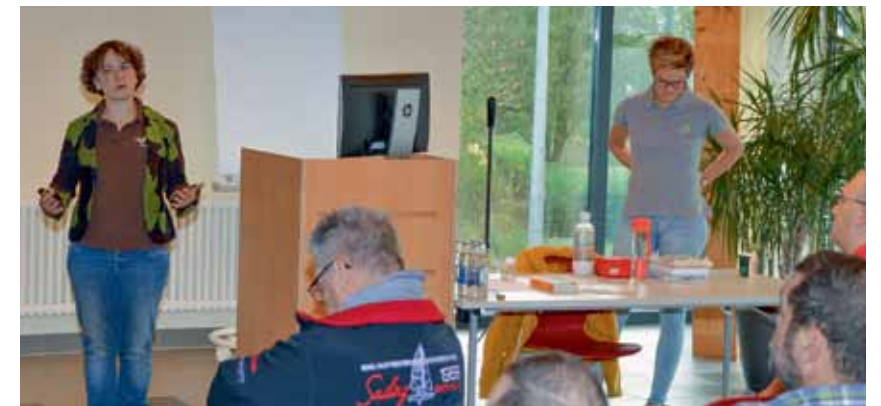
Die Beratungsstelle von natur&ëmwelt organisierte im Laufe des letzten Jahres zwei Fortbildungen für Feuerwehrleute zum nachhaltigen Umgang mit Wespen.

Natur und wurde von einer Biologin von natur&ëmwelt bedient. Von Juli/August bis Oktober wurde die Falle einmal in der Woche für 24 Stunden angeschaltet. Der wöchentliche Fang wurde jeweils in Gefrierbeutel gefüllt und tiefgekühlt aufbewahrt.