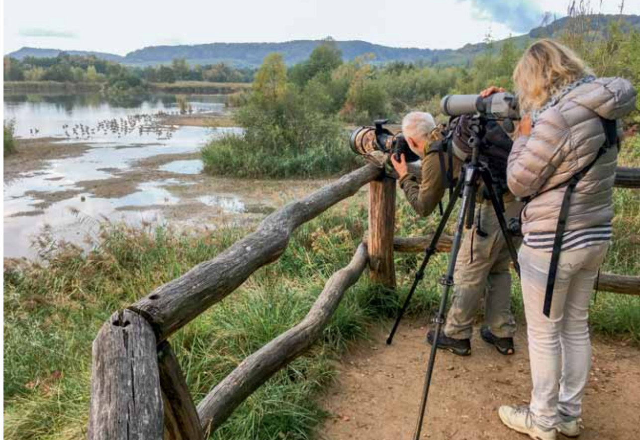
Nicht nur um das Naturschutzgebiet Haff Réimech werden zahlreiche Guides nature gebraucht, die im Rahmen eines von natur&ëmwelt koordinierten Trainingsprogramms ausgebildet werden.