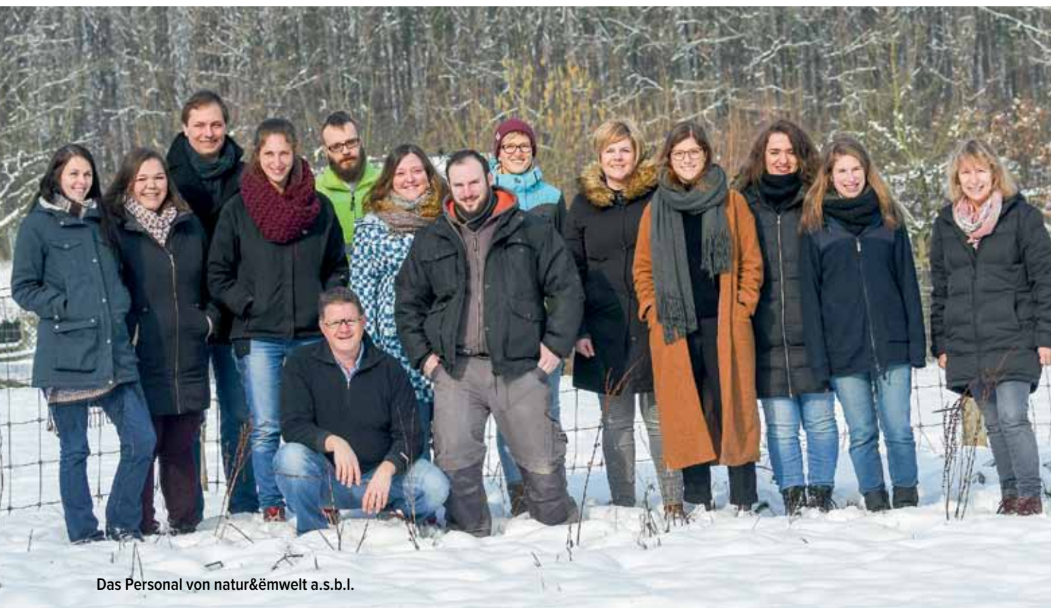
Das Personal von natur&ëmwelt a.s.b.l.

10.723 Mitglieder in 29 lokalen Mitgliedsvereinigungen | 40 Partnervereinigungen mit über 50 000 Mitglieder