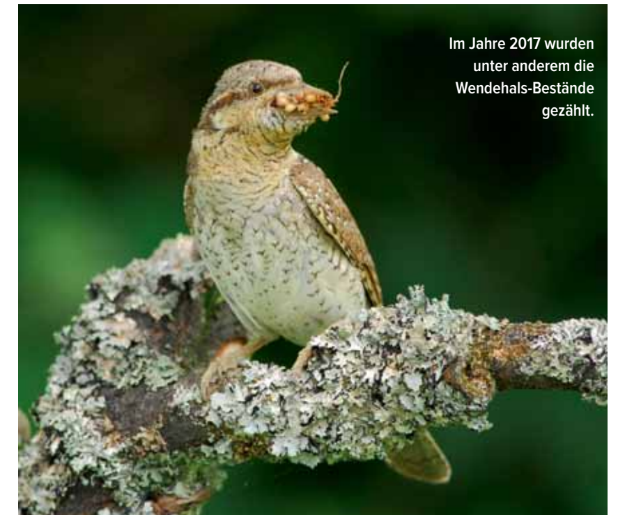
Im Jahre 2017 wurden unter anderem die Wendehals-Bestände gezählt.

vor. Im Rahmen der Fernseh-Serie „Eist wëllt Lëtzebuerg“ konnte die COL die Kurzdokumentationen zum Rotmilan und Weißstorch beitragen.