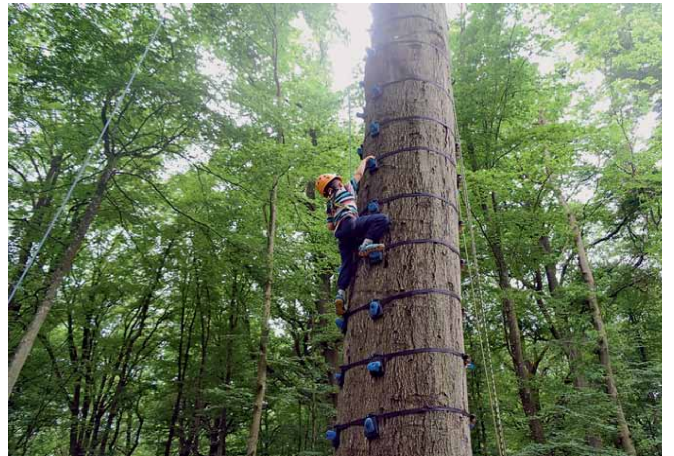
Etwa 3.500 Besucher nahmen am Fest vun der Natur in Kockelscheuer am Wochenende vom 18-19. Juni rund ums Thema Natur und Nachhaltigkeit teil.