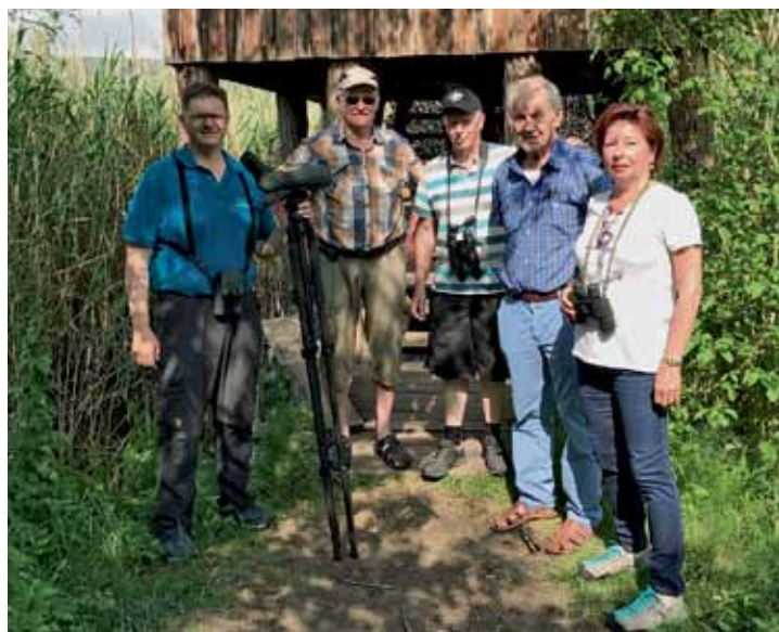
Besichtigung des Biodiversum in Remerschen.

Am Nationalen Tag des Baumes wurden 6 eingegangene Obstbäume durch zwei Apfelbäume, einen Zwetschgenbaum und einen Mirabellenbaum im Bongert auf Flickefeld ersetzt.