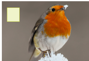
Routbrëschtchen Rotkehlchen Rougegorge familier Robin