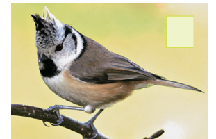
Hauwemees Haubenmeise Mésange huppée Crested tit