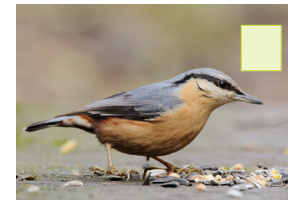
Kuesleefer Kleiber Sittelle torchepot Nuthatch