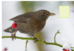
Märel Amsel Merle noir Blackbird