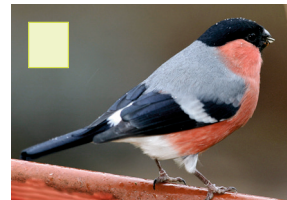
Pillo Gimpel Bouvreuil pivoine Bullfinch