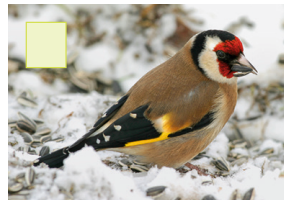
Dëschtelpéckchen Distelfink Chardonneret élégant Goldfinch