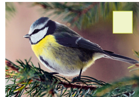
Blomees Blauweise Mésange bleue Blue tit