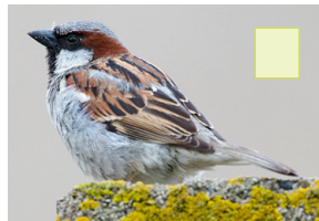
Hausspatz Hausperling Moineau domestique House sparrow