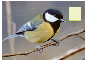
Schielmees Kohlmeise Mésange charbonnière Great tit