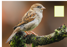
Hausspatz Hausperling Moineau domestique House sparrow