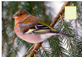
Poufank Buchfink Pinson des arbres Chaffinch