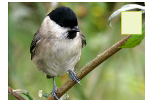
Gro Mees Sumpfmeise Mésange nonnette Marsh tit