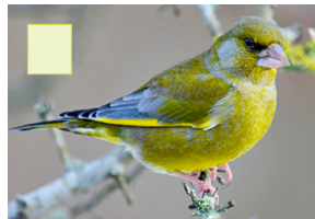
Gränge Fénk Grünfink Verdier d'Europe Greenfinch