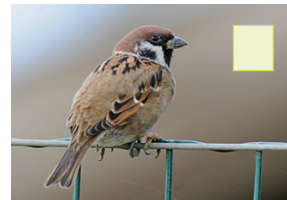
Feldspatz Feldsperling Moineau friquet Tree sparrow