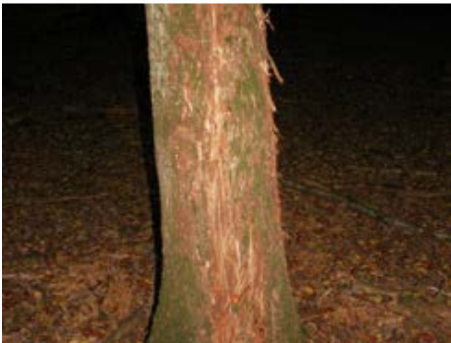
Reviermarkierung durch Hirsch(stier)

Eine gezielte Reduzierung der Schalenwildbestände ist aus Natur-, Umwelt- und Klimaschutzüberlegungen sowie aus Sicht des Tierschutzes demnach dringend notwendig, um die Naturverjüngung sowie Neupflanzungen und somit die Zukunft unserer Wälder zu erhalten.