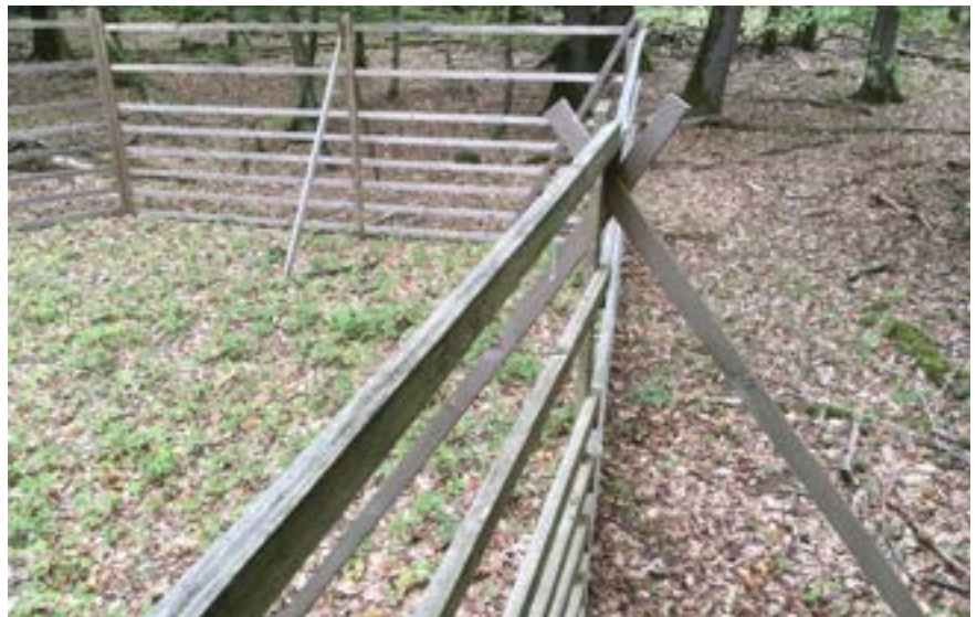
Mittels Weisergatter lässt sich der Druck des Schalenwildes auf die Naturverjüngung veranschaulichen (Weisergatter in einem Stieleichen-Hainbuchen Bestand, Friemholz bei Echternach, 2019)

Diese Fakten sollten auch mit den im Folgenden genannten wissenschaftlichen Instrumenten vermittelt werden.