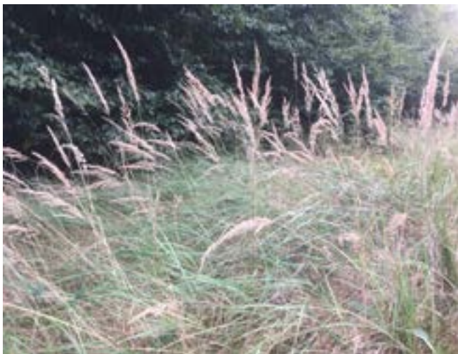
Die rauen Blätter des Waldreitgrases werden von Reh und Hirsch verschmät, so dass sich diese Art besonders auf den tonigen Keuperböden durchsetzt und der dichte Wurzelfilz eine spätere Naturverjüngung gefährdet (Waldreitgras, 2019)