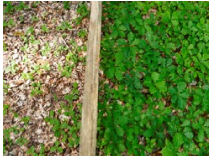
Das Fehlen jeglicher Jungeichen außerhalb des Gatters zeigt den hohen Wildbestand. Wieviel dem Frassdruck der Wildschweine auf die Eicheln beziehungsweise der Rehe auf die Jungeichen geschuldet ist, lässt sich hier nicht erkennen. Detailaufnahme innerhalb (links) und außerhalb (rechts) des Gatters

Die zahlreichen Wildschweine ihrerseits lieben Eicheln und Buchecker, sodass auch die Fortpflanzung von Bäumen auf diesem Wege aufgrund zu hoher Wildschweinebestände, nur noch sehr begrenzt erfolgen kann.