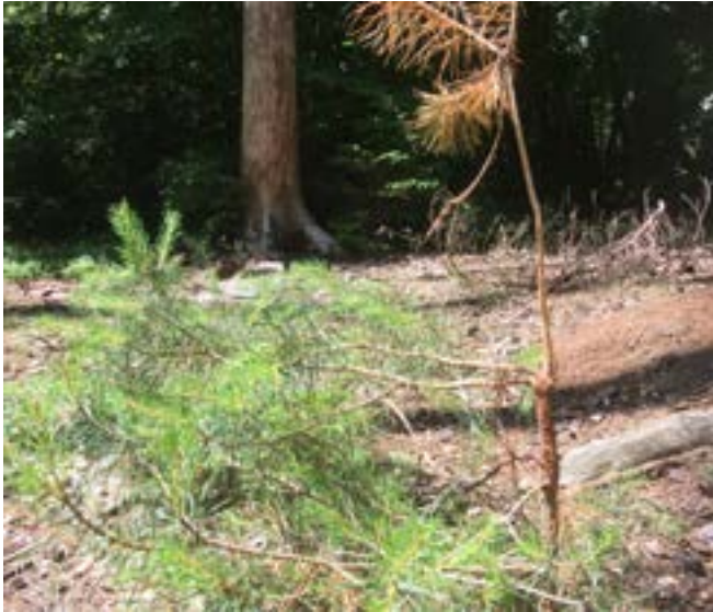
Fegeschäden an Waldkiefer durch Rehbock