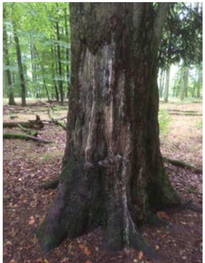
Massive Schäden von Rothirsch an Douglasie (Rouscht 2019)