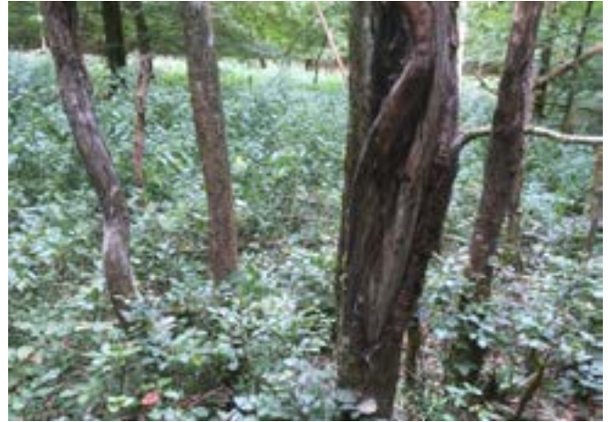
Schälsschäden an Eschen durch Rothirsch (Rouscht 2018)

Zusammengefasst: zu viel Wild frisst gerade jene Jungbäume bzw. Eicheln und Buchecker auf, die dringend ältere absterbende Bestände ersetzen sollten.